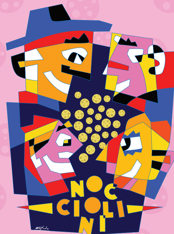
Illustrazione opera del Maestro Ugo Nespolo